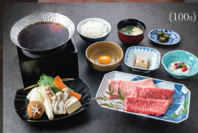
Set Lẩu Sukiyaki (Bò Wagyu) 450K