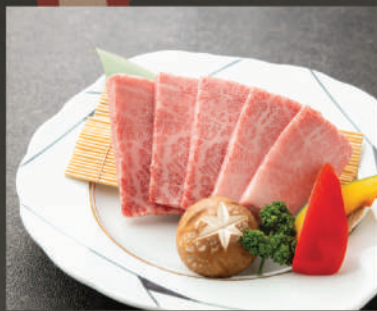
Saloin - Thăn ngoại 880K (100g)