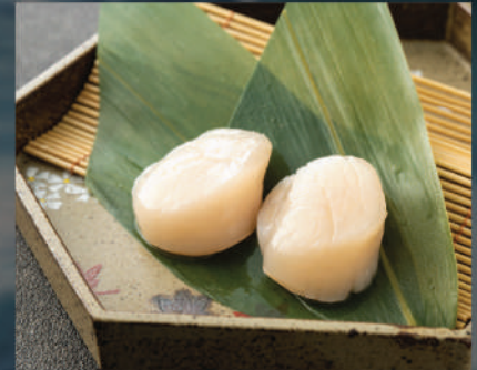
Sò điệp 98K