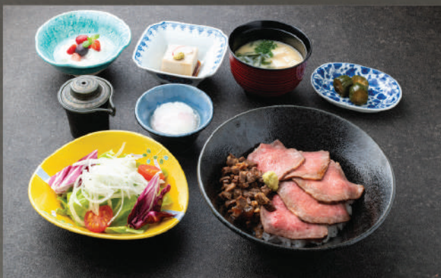
Set cơm Wagyu nướng