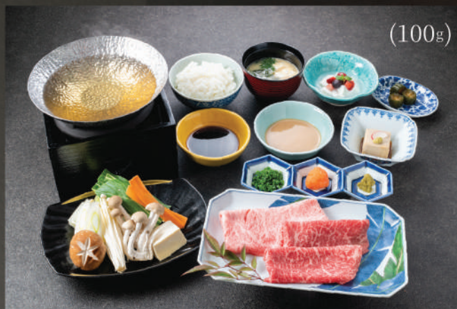
Set Lẩu Shabu Shabu (Bò Wagyu) 450K