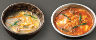
Súp rau củ