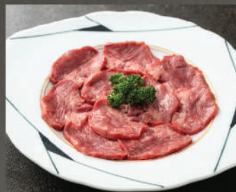
Cuống lưỡi bò 520K (100g)