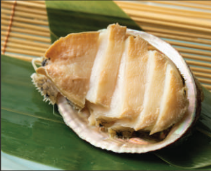
Bào ngư 300K