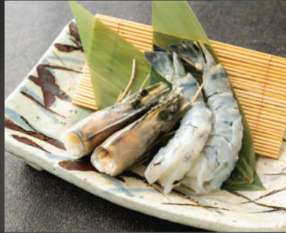
Tôm sú lớn 200K