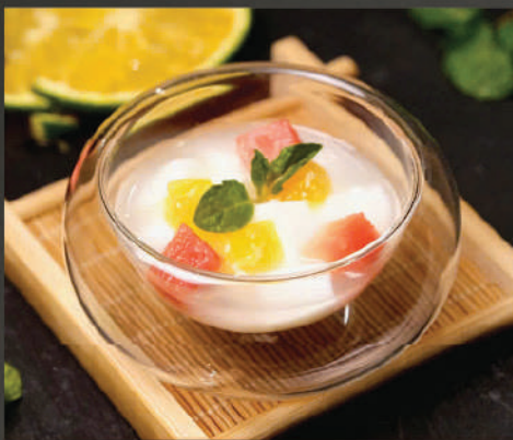
Thạch sữa 80K