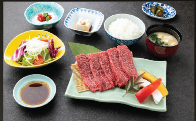
Set Wagyu thịt đỏ nướng