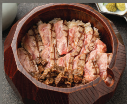
Hitsumabushi (Cơm 3 tầng vị)