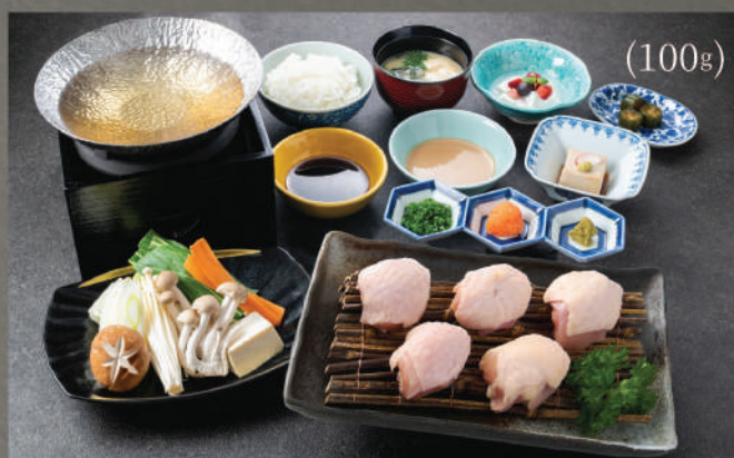
Shabu Shabu Set (Đùi gà) 250K