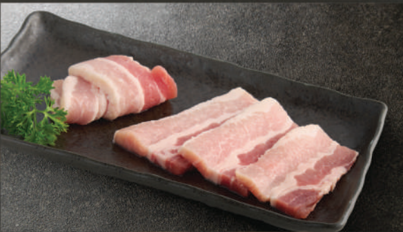
Ba chỉ heo Hokkaido 280K (100g)