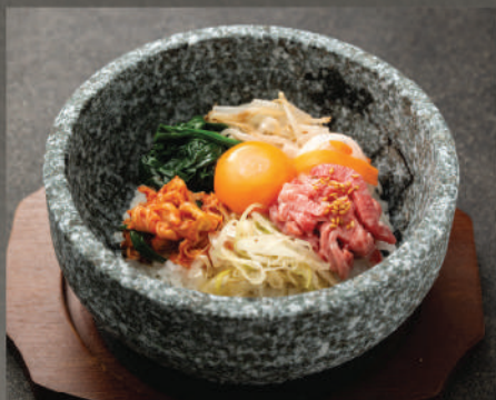
Cơm trộn bát đá