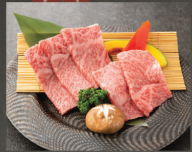
Ichibo 580K (100g)