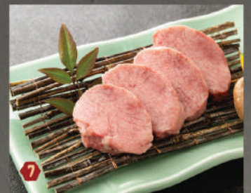
Cuống lưỡi bò cắt dày 580K (100g)