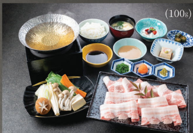
Set Lẩu Shabu Shabu (Heo Hokkaido) 350K