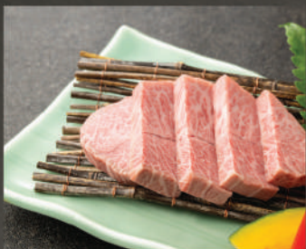
Misuji 480K (100g)