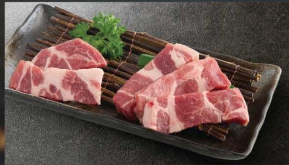
Thăn vai heo Hokkaido 300K (100g)