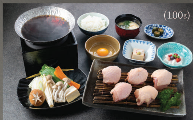
Sukiyaki Set (Đùi gà) 250K