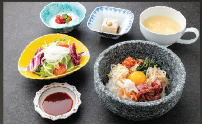
Set cơm trộn bát đá