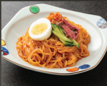
Mỳ trộn cay