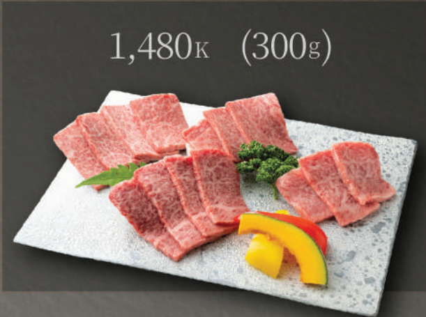
Combo thịt cao cấp