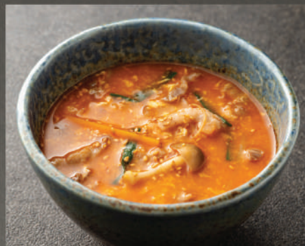
Cơm súp cay kiểu Nhật