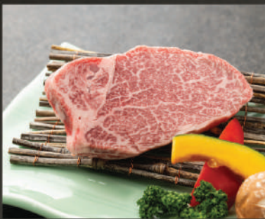
Hire - Thăn nội 980K (100g)