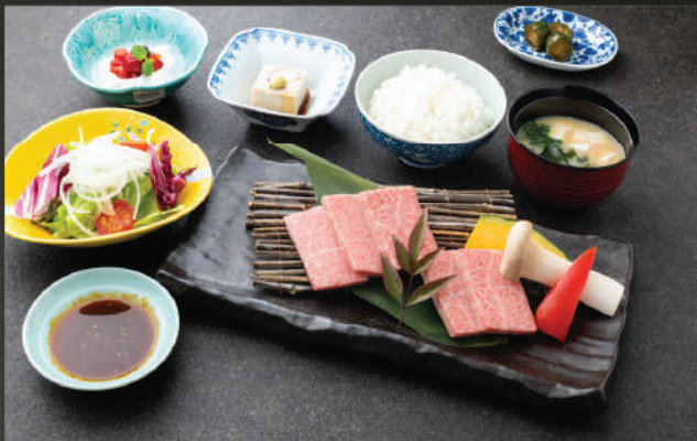
Set Wagyu cao cấp nướng