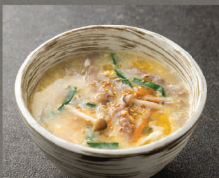
Cơm súp kiểu Nhật