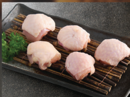
Đùi gà 200K (100g)