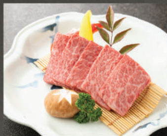
Kuri 450K (100g)