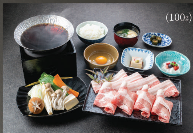
Set Lẩu Sukiyaki (Heo Hokkaido) 350K