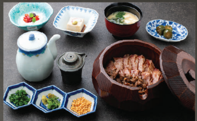
Set Hitsumabushi - Cơm 3 tầng vị