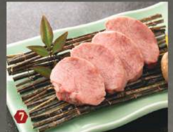
厚切タンモト (US) 580K (100g)