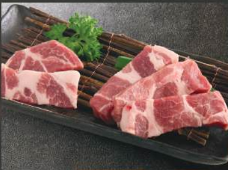
豚バラ 280K (100g)