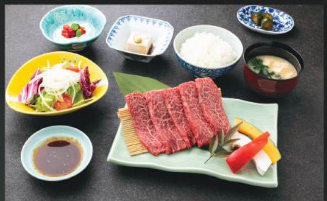
BBQ本日の赤身和牛定食 380K