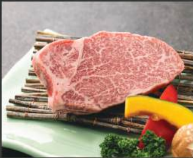
ヒレ 980K (100g)