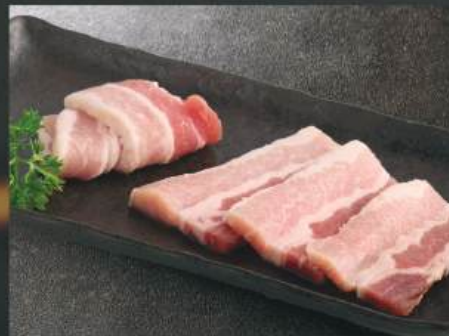
豚肩ロース 300K (100g)