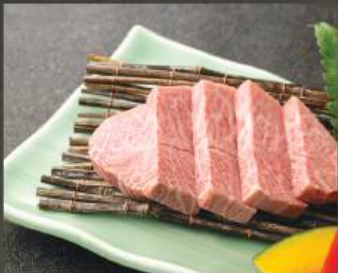
ミスジ 480K (100g)