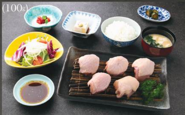
BBQ鶏モモ 定食 280K