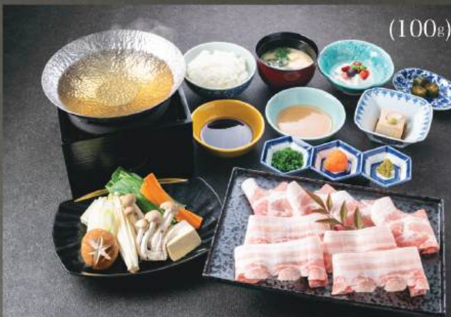
豚しゃぶしゃぶ 定食 350円