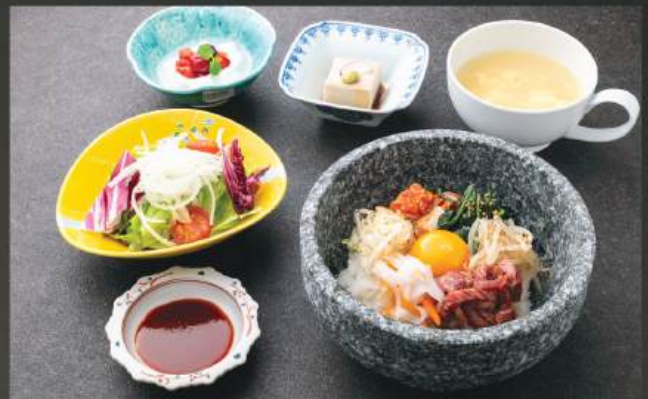
石焼ビビンバ定食 160K