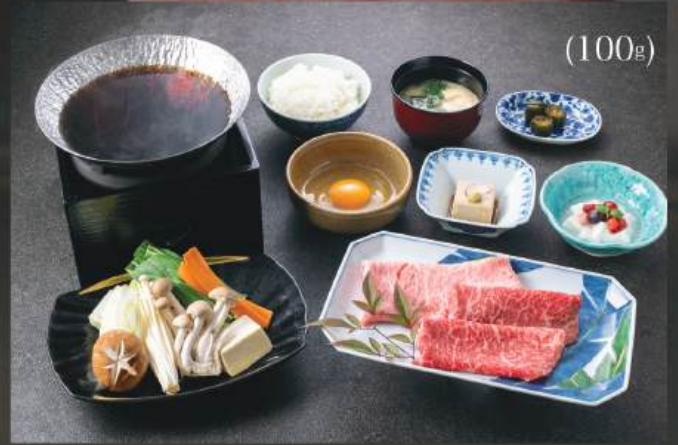
和牛すき焼き 定食 450円