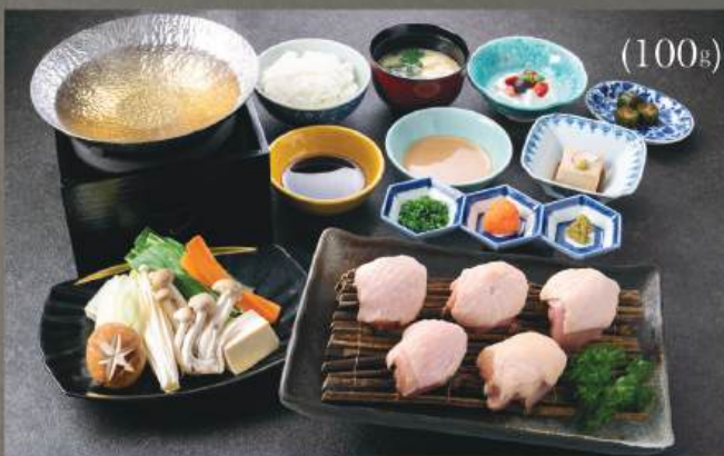
鶏しゃぶしゃぶ 定食 250円