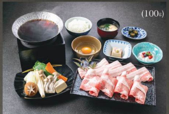
豚すき焼き 定食 350円