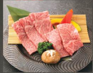
イチボ 580K (100g)