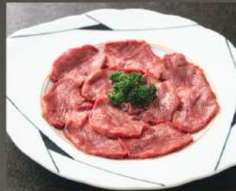
タンモト (US) 520K (100g)