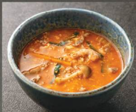
ユッケジャンクッパ 120K