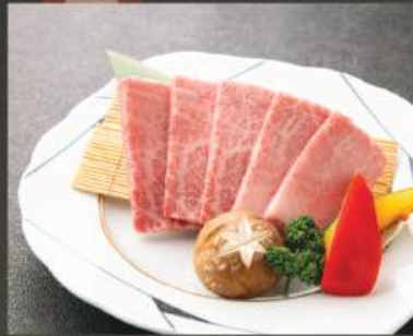
サーロイン 880K (100g)