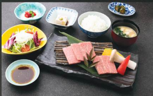
BBQ本日の霜降り和牛定食 480K