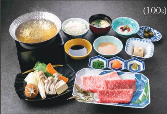
和牛しゃぶしゃぶ 定食 450円