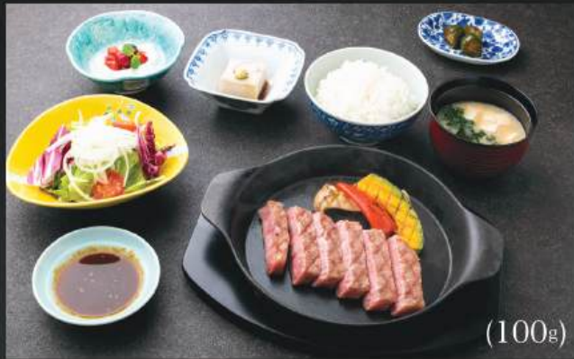
本日の霜降り和牛ステーキ定食 580K