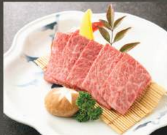
クリ (ウデ) 450K (100g)