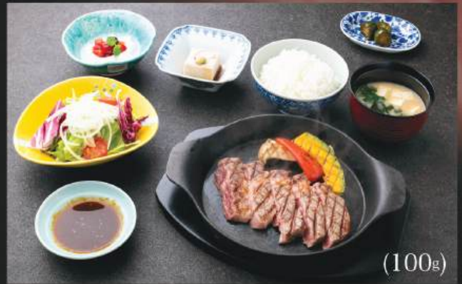
本日の赤身和牛ステーキ定食 480K