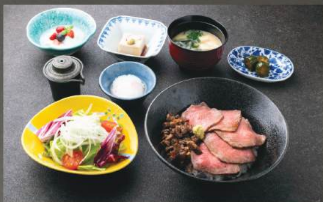
ローストビーフ丼定食 250K