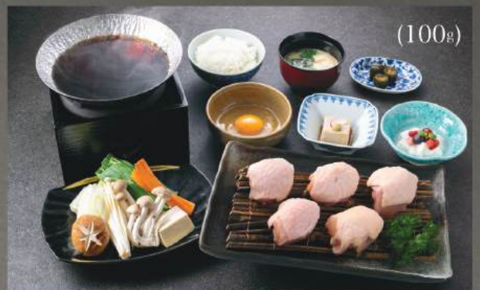
鶏すき焼き 定食 250円